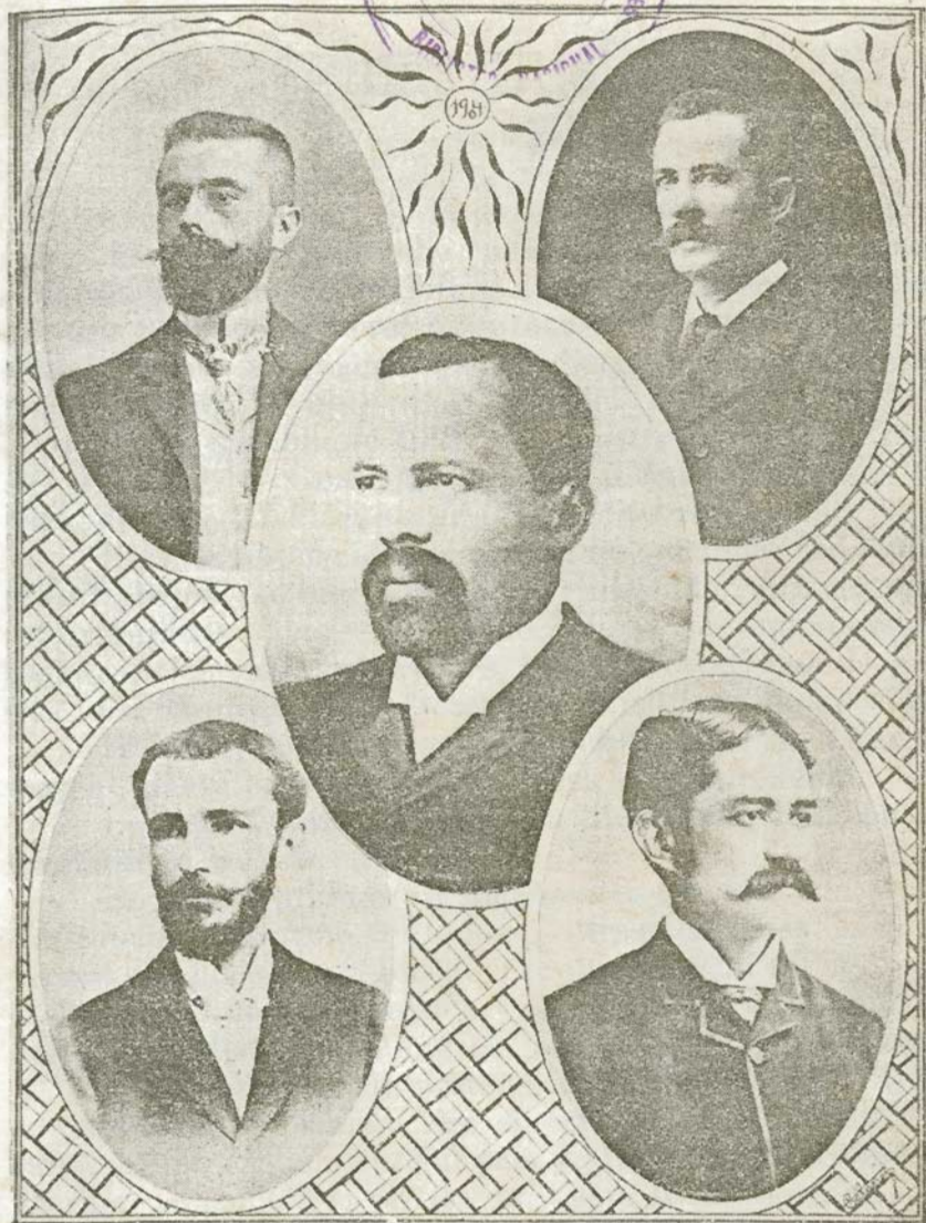
Liedo, don Ascención Esquivel Presidente de la República